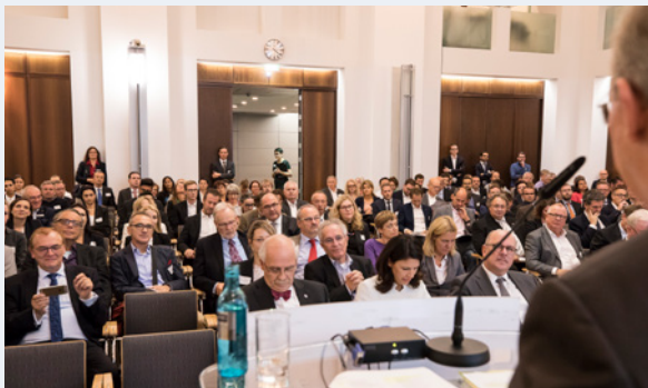
Diskussionen und Vorträge mit Praxisbezug

Kurzum: Der eHealth-Kongress 2018 zeigt, dass die telemedizinische Entwicklung in Rhein-Main und Hessen immer stärker in Fahrt kommt. Seien Sie dabei und nutzen Sie die einmalige Gelegenheit.