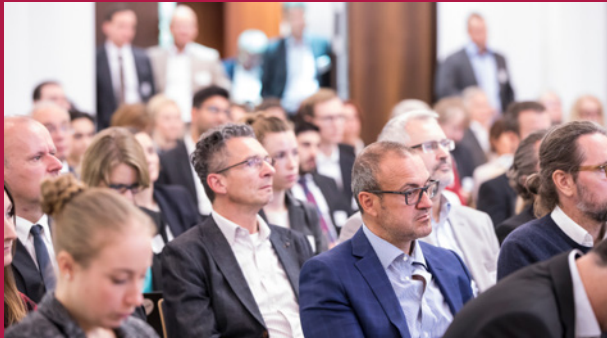
Fachforen ziehen das Publikum in ihren Bann