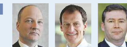
Müller Göller Brüche