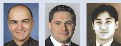
Okhovat-Esfehani Schneider Glugla