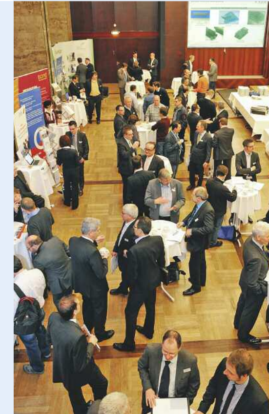
Mehr als 270 Teilnehmer bei der Lean-Konferenz 2013